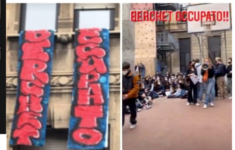
Alcuni frame dell'occupazione del liceo Berchet (Instagram: ...)