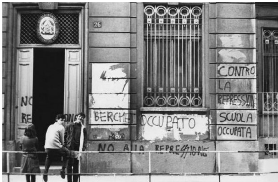
Foto della prima occupazione del Berchet nel '68

Manteniamo alto l'onore di questo storico liceo