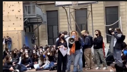
Un momento dell'assemblea al Berchet (IG)

T orna ad essere (parzialmente) occupato il liceo classico Berchet di via della Commenda a Milano. Gli studenti,